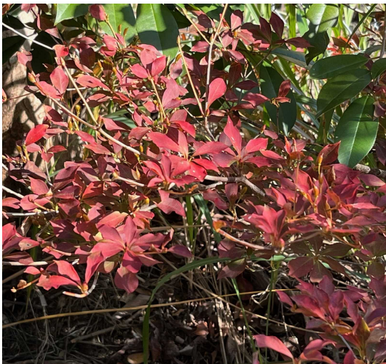
(ドウダンツツジの紅葉 自宅 2023.11.25)

マ」、「人間関係のいざこざ」等々、さまざまな経験や体験は、記憶という引き出しにあふれるほど蓄積されるはずなのに…。