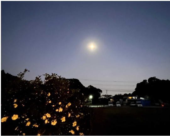
(山茶花と月 自宅 2023.11.25 17:51)

「困難を乗り越える」「苦難を克服する」「修羅場をくぐる」「危機を乗り越える」など、人生において「乗り越える」ことは本当に多いものです。