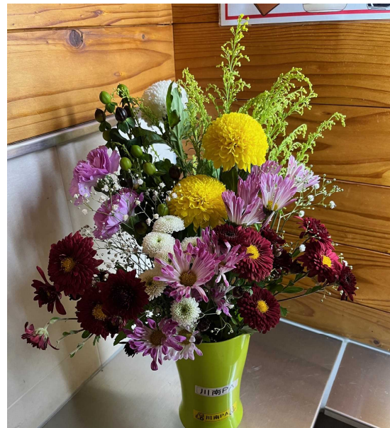
(美しい花々 川南 SA 2023.11.25)

神は真実な方です。あなた方を耐えられないような試練に遭わせることはなさらず、試練とともに、それに耐えられるよう、逃れる道も備えてくださいます。