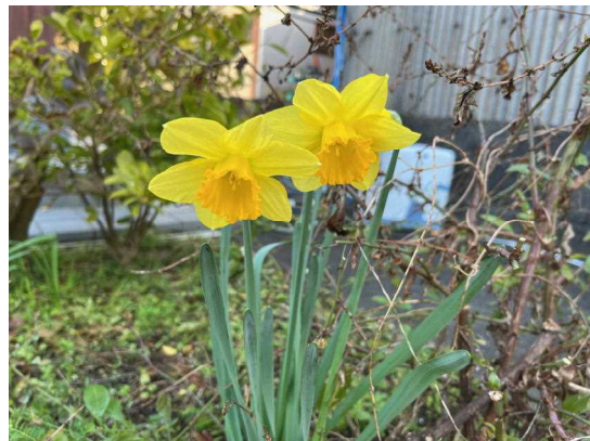
(スイセン 宮崎市 2024.2.18)

目の前で、答辞を述べる代表者、その言 葉のひとつひとつに、限られた数年間が集 約され、まるでその時に、その場にいたか のような気持ちになる。代表ではあるが、 その人も青春時代を生きてきたその人なの だ。まさに青春時代の象徴なのだ。