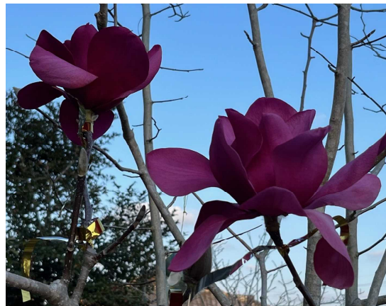
(シモクレン 宮崎市 2024.2.17)

目の前で、答辞を述べる代表者、その言 葉のひとつひとつに、限られた数年間が集 約され、まるでその時に、その場にいたか のような気持ちになる。代表ではあるが、 その人も青春時代を生きてきたその人なの だ。まさに青春時代の象徴なのだ。