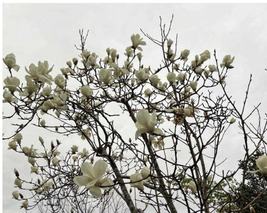
(ハクモクレン 宮崎市 2024.2.23)