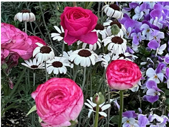
(ランタンキュラス USJ 大阪市此花区 2024.3.7)