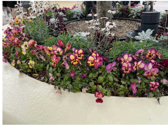
(ビオラ USJ 大阪市此花区 2024.3.7)

窓辺につづく 渚から 顔をそむけたのは 涙を こらえるためじゃない 不安が 不安が つのるんだ 膝にかかえた ポストンバック 海の匂いが まだ残る