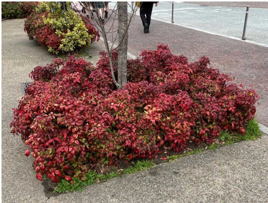
(オタフクナンテン 大阪市阿倍野区 2024.3.8)

もちろん宮崎市も宮崎県全体の4割に住む中核市である。が、都会とは言い切れないだろう。