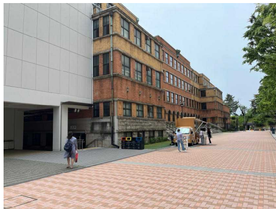
(上智大学四谷キャンパス 1号館 2024.4.29)

The capacity to wait is probably one of the most important things we have to learn.