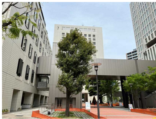
(上智大学四谷キャンパス 7号館 2024.4.29)

そのため、結果を期待しすぎて、自分 の願いとはほど遠い「結果」を手に入れ ることになっているのではないかと。