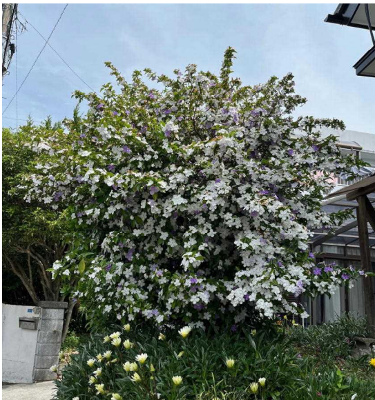
(マツリカ 延岡市緑ヶ丘 2024.5.2)

この曲を初めて聞いたとき、まだ 20 代 そこそこだったせいも、辛抱強い歌詞だな と思ったものだった。とにかく待つ、チ ャンスを待つ、そんなイメージ…!