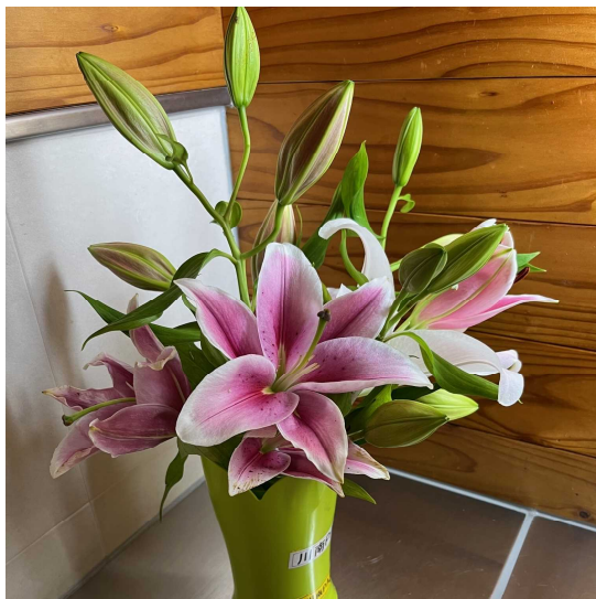
(ゆり 川南 SA 2023.6.4)

雑談によって、相手との距離が縮まり、それが信頼関係につながる。その結果、商談も進むようになる。これこそ、雑談の力ではないかと思えます。