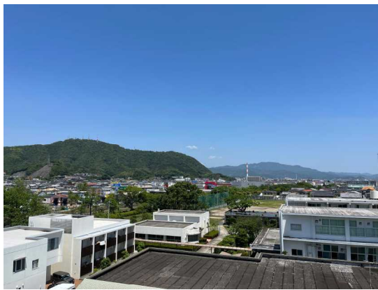
(屋上から眺める 記念体育館 2023.6.3)